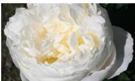
Mme Claude Tain