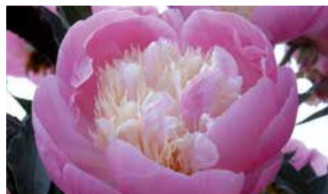
Bowl of Beauty