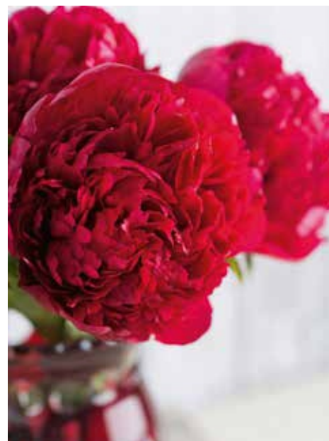
Many Happy Returns