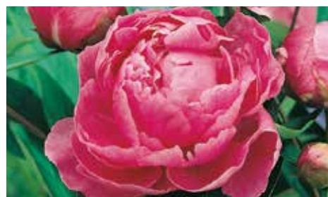
Dr. Alexander Fleming