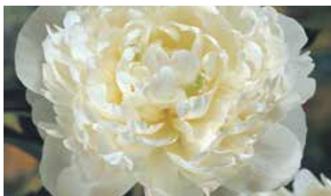
Duchesse de Nemours