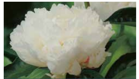
Bowl of Cream