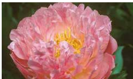
Pink Hawaiian Coral