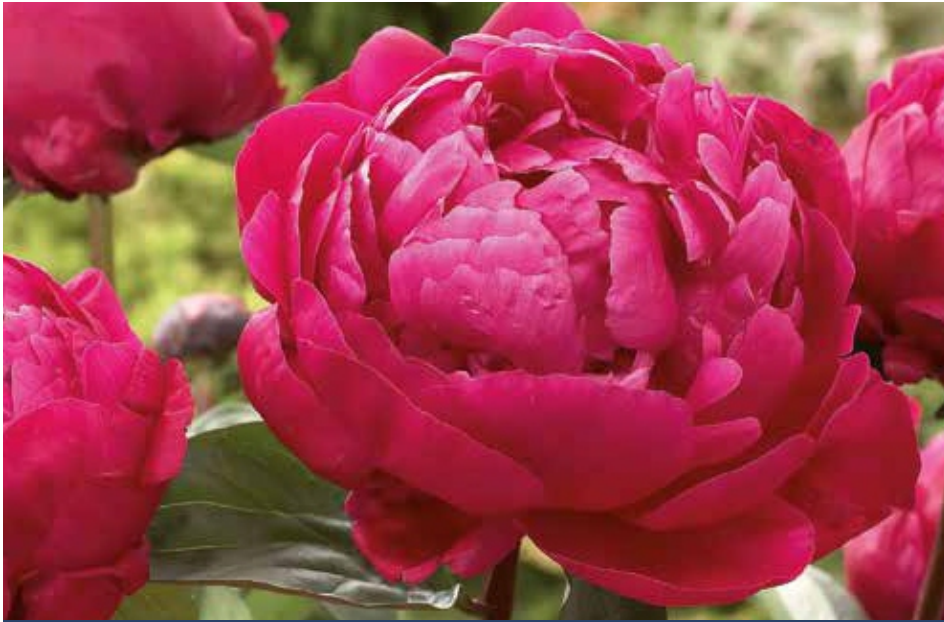
Red Sarah Bernhardt